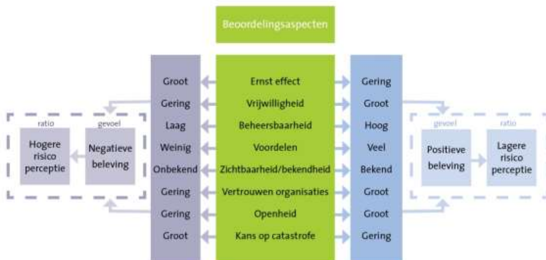
Figuur 1: Aangepast model Risicocommunicatie: wanneer worden mensen (niet) ongerust? (LCM, 2006. Aanpassing Provinciale Raad Gezondheid, 2014)

Er zijn veel factoren die verklaren waarom mensen ongerust of angstig zijn. In de richtlijn voor risicocommunicatie van de GGD is een goed onderbouwd en praktisch hanteerbaar model gepresenteerd (Landelijk Centrum Medische Milieukunde, 2006). Hierin worden de volgende indicatoren voor risicoperceptie onder burgers genoemd: 1) ernst van het effect, 2) vrijwilligheid, 3) beheersbaarheid, 4) voordelen, 5) zichtbaarheid/bekendheid, 6) vertrouwen organisaties, 6) openheid en 7) de kans op een catastrofe. In de factsheet risicocommunicatie van de Provinciale Raad Gezondheid (2014) is dit model aangepast zodat het een duidelijk beeld geeft hoe deze indicatoren kunnen zorgen voor een bepaald gevoel; een positieve of negatieve beleving van burgers (figuur 1).